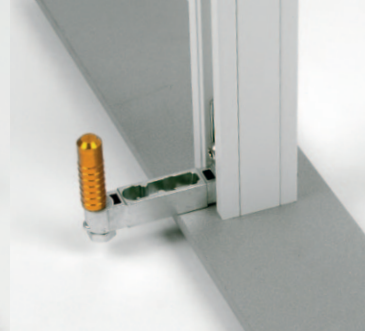
Anbindung an Profil, mit D3 connection to profil, with D3