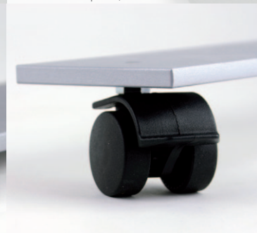
Fußplatte mit Rolle mit Feststeller Base Plate including Caster with Brakes