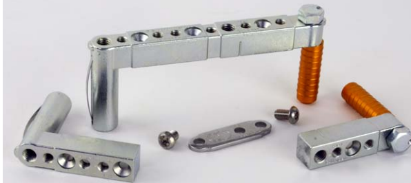
G40 Verbinder mit Exzenter +2,5/-2,5mm G40 connector with off-center +2,5/-2,5 mm

neue 3mm Platten mit Torx Schrauben . new 3mm plates with Torx screws